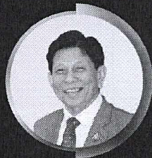
ศ.ดร.สนิก อักษรแก้ว ประธานสภาพัฒนาการ เศรษฐกิจและสังคมแห่งชาติ